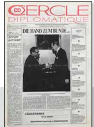
Gegründet 1971 – Erstes Cover

Österreichs einziges zweisprachiges Informationsmedium für das Diplomatisches Corps. Für die Mitarbeiter der mehr als 40 Internationalen Organisationen mit Sitz in Wien. Für Entscheider in Österreichs Politik, Wirtschaft, Tourismus, Kunst und Kultur.