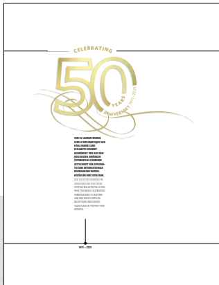
Einblick in die Jubiläumsausgabe